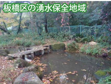
板橋区の湧水保全地域