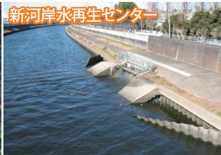
新河岸水再生センター

ガイド:板橋区 資源環境部 環境政策課 ガイド:東京都下水道局 西部第二下水道事務所