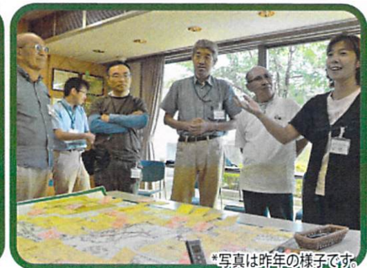
*写真は昨年の様子です