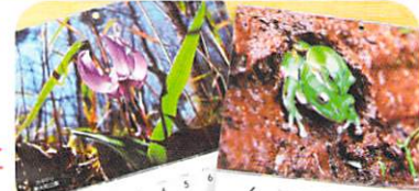
昨年の完歩賞「公園特製カレンダー」